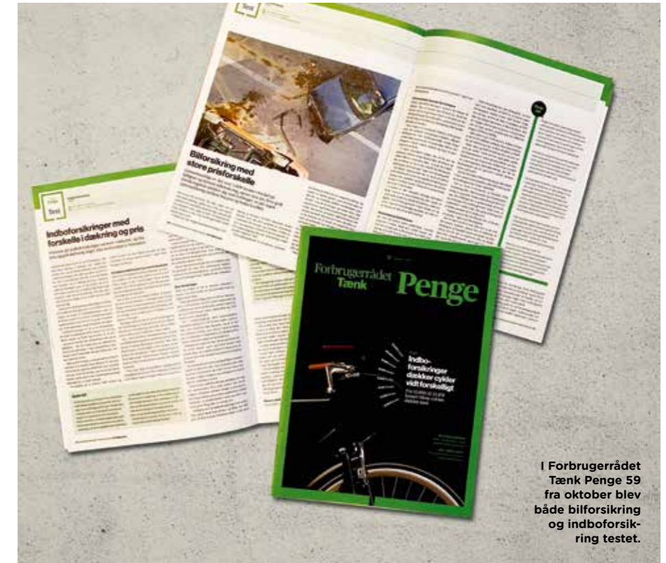
I Forbrugerrådet Tænk Penge 59 fra oktober blev både bilforsikring og indboforsikring testet.

“Du får den vigtigste dækning hos alle selskaberne i testen. De forskelle, der er, og der er forskelle, er primært på nogle detaljer i for-